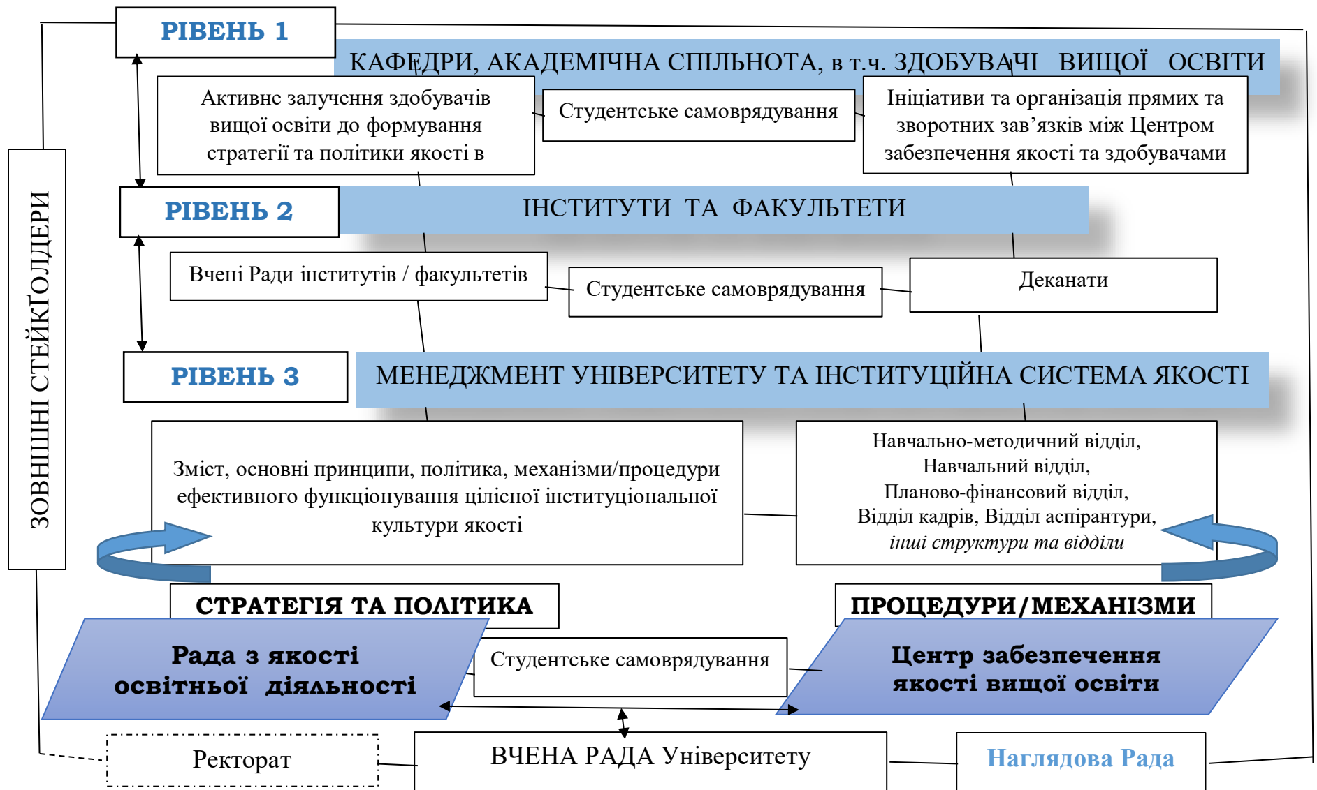
Рис. 2 – Структура системи забезпечення якості освітньої діяльності в Університеті