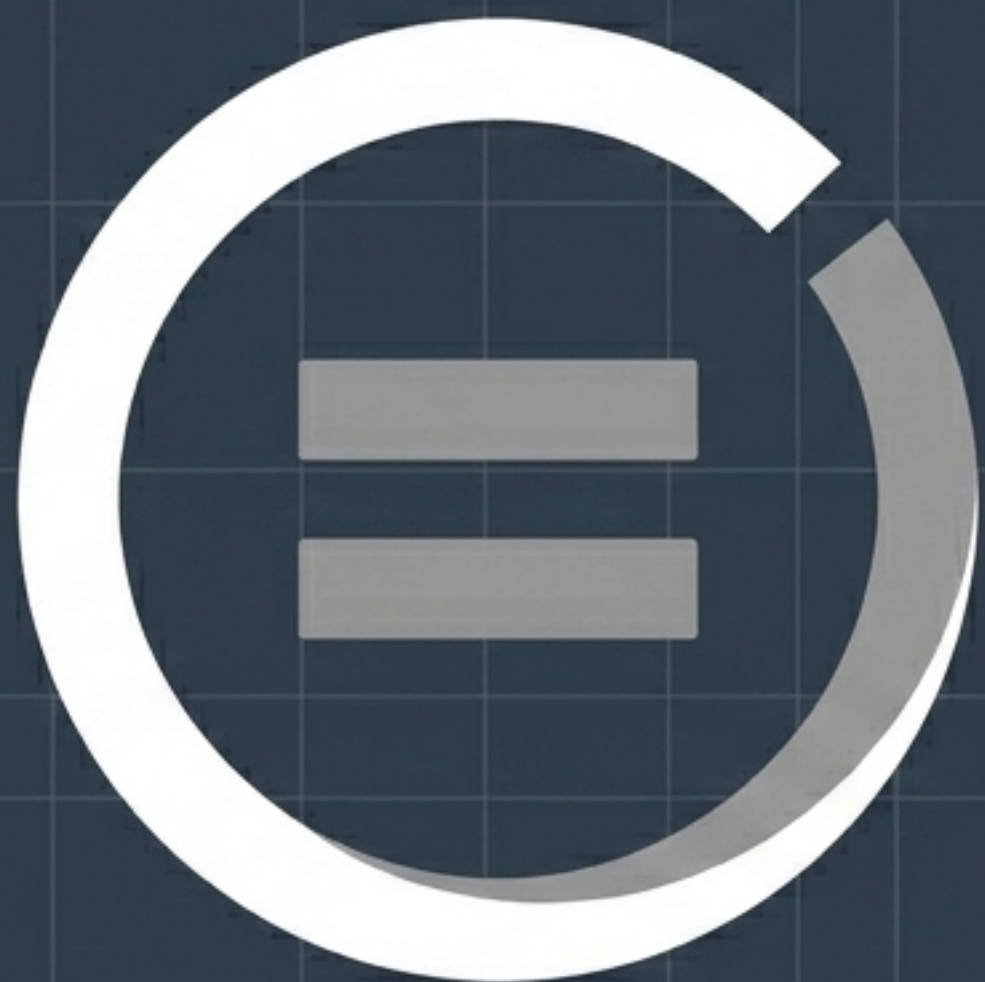
ЦСР 10: Зменшення нерівності